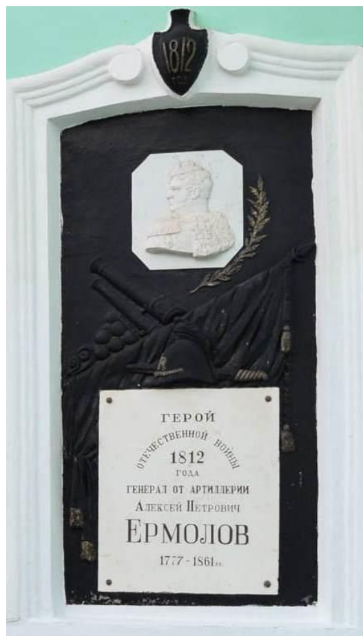
Надгробие А. П. Ермолова

В 2013 году при проведении в Свято-Троицкой церкви реставрационных работ были вскрыты старые полы в правом приделе храма, где расположен склеп Ермоловых. Были обнаружены грабительские лазы в погребениях.